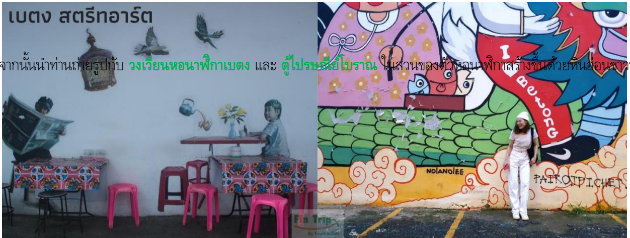
จากนั้นนำท่านถ่ายรูปกับ วงเวียนหอนาฬิกาเบตง และ ตู้ไปรษณีย์โบราณ ในส่วนของตัวหอนาฬิกาสร้างขึ้นด้วยหินอ่อนขาวที่มีอยู่มาก

จากนั้นนำคณะเดินชมจุดเด่นที่ได้รับความนิยมของตัวเมืองเบตงได้แก่ สตรีทอาร์ท หรือ ถนนศิลปะ งานศิลปะที่สะท้อนเรื่องราวและวิถีชีวิตของความเป็นเบตงได้อย่างดี จุดเริ่มต้นของการสร้างสรรค์ผลงานที่งดงามดังกล่าว เกิดจากทาง อ.เบตง จ.ยะลา ได้มีการจัดงาน 111 ปี เล่าขานตำนานเมืองเบตง ซึ่งมีจุดประสงค์เพื่อสร้างหมุดหมายที่แสดงออกถึงวิถีชีวิตของชาวเบตงและ สร้างจุดดึงดูดนักท่องเที่ยวทั้งชาวไทยและชาวต่างชาติ